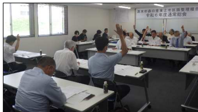
【写真は令和6年度通常総会の様子】