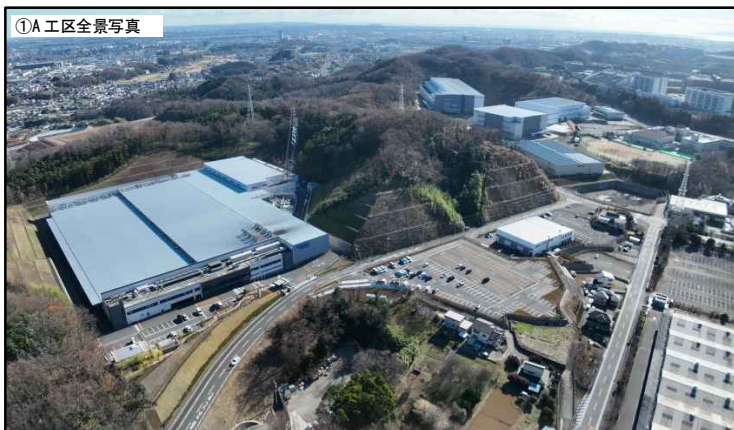
令和 5 年 12 月 撮影