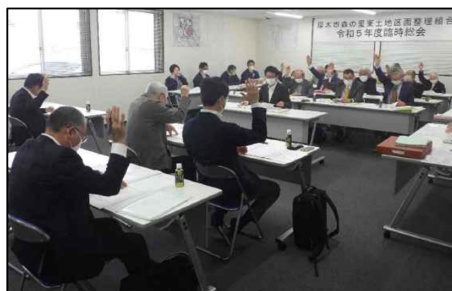
【写真は令和5年度臨時総会の様子】