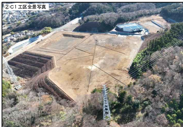
令和 5 年 12 月 撮影