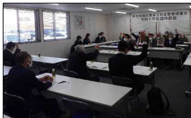
【写真は令和4年度臨時総会の様子】