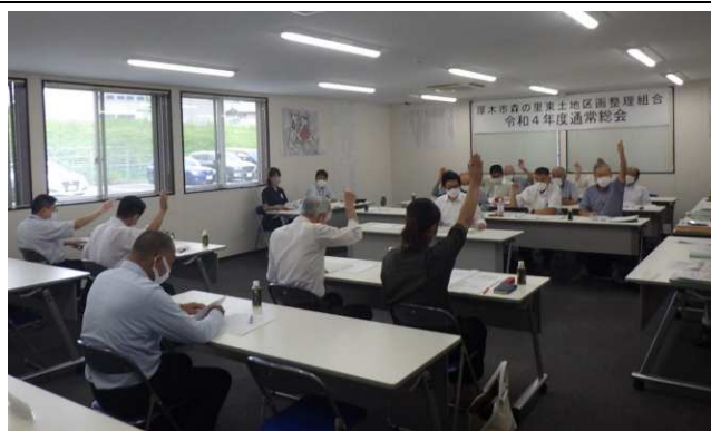
【写真は令和4年度通常総会の様子】