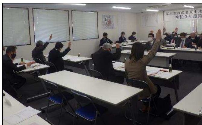
【写真は令和3年度臨時総会の様子】