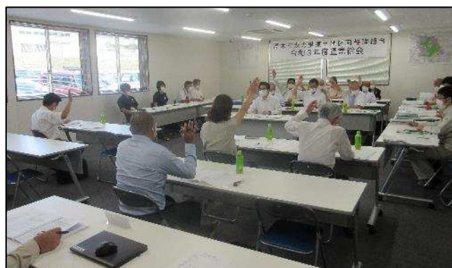
【写真は令和3年度通常総会の様子】