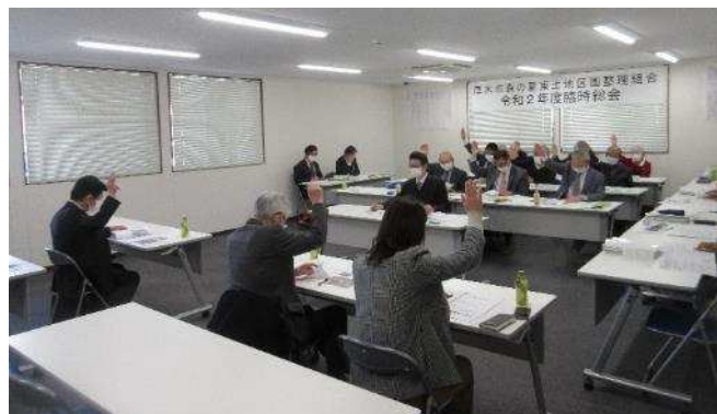
【写真は令和2年度臨時総会の様子】