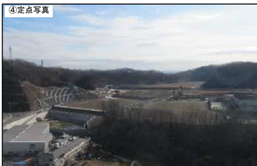
令和 2 年 2 月撮影