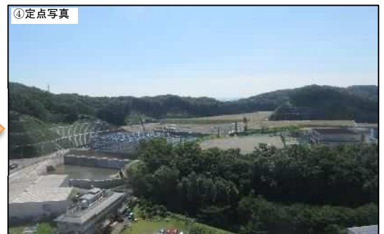
令和 2 年 7 月撮影