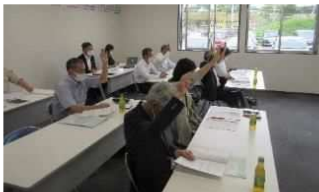
【写真は令和2年度通常総会の様子】