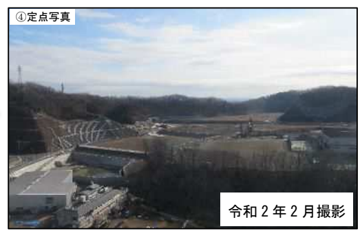
※ (株) メイテック屋上からの定点撮影