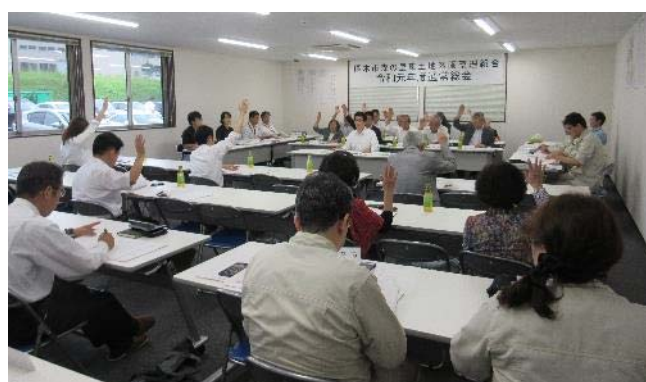
【写真は令和元年度通常総会の様子】