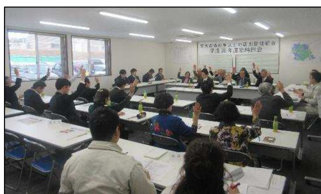
【写真は平成30年度臨時総会の様子】