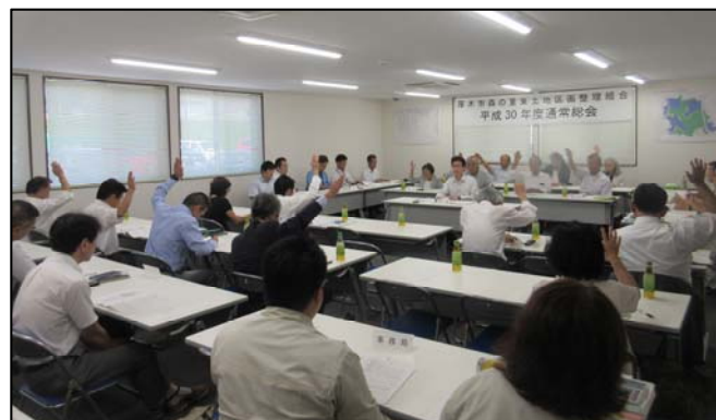
【写真は平成30年度通常総会の様子】