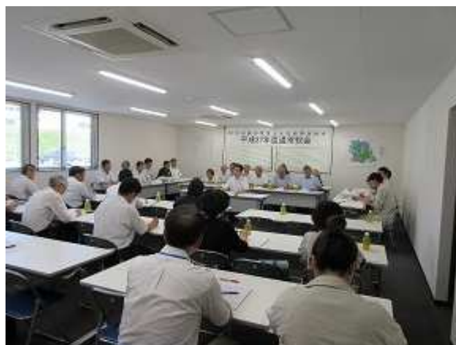
【写真は平成27年度通常総会の様子】